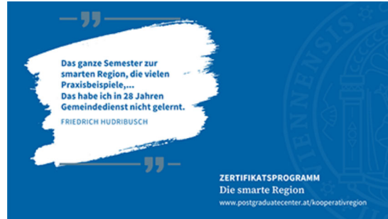
Kooperative Stadt- und Regional-Forschung - Alumni-Stimmen Postgraduate Center

On 09.12.2025, the second Bake Your Research event invited doctoral students and supervisors to showcase their research in a deliciously creative way. A total of 13 participants wowed everyone with their culinary interpretations of their research topics. Congratulations to all involved! More