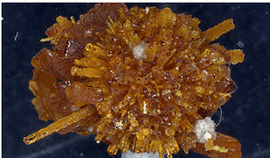
Studierende entdecken im Labor ein Mars-Mineral Mineralogie und Kristallographie