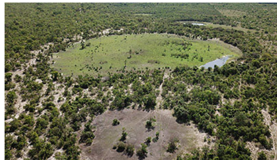
"Feenkreise": Hinweise auf die Tiefe von natürlichen Wasserstoffquellen Geologie

Eine im Labor künstlich hergestellte Eisensulfat-Verbindung wurde anschließend auf ihr spektrales Signal untersucht. Die Überraschung: Dieses Signal stimmt mit einem Spektralsignal vom Mars überein, das die NASA zuvor nicht zuordnen konnte. Mehr