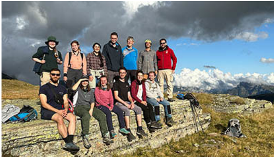
Riffe, Lagunen und Vulkane in den Südtiroler Dolomiten Erdwissenschaften

Im Rahmen einer zehntägigen Fachexkursion reisten 19 Studierende nach Serbien sowie Bulgarien und gestalteten eine virtuelle Storymap. Mehr Seit Herbst 2025 gelten die Lehrpläne für drei neue Geographie-Masterstudien. Mehr Das neue verkürzte Lehramtsstudium soll bereits ab Wintersemester 2026/27 starten.