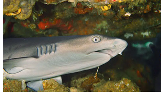
Artenrückgang statt Artenzunahme bei Haien und Rochen seit dem Eozän Paläontologie