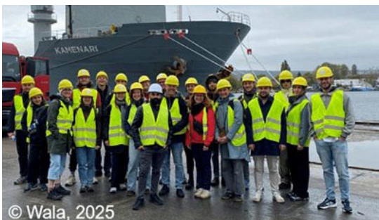
© Wala, 2025 Von postsozialistischer zur kapitalistischen Stadtentwicklung? Geographie