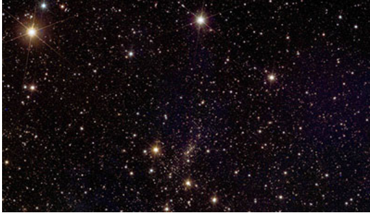
Licht ins Dunkle Universum bringen: Neuer SFB unter Uni Wien-Beteiligung Astrophysik

Die Astrophysiker*innen Oliver Hahn und Sylvia Ploeckinger erforschen im Rahmen des neuen Spezialforschungsbereichs DUNE die Dunkle Materie und die Dunkle Energie im Universum. Mehr