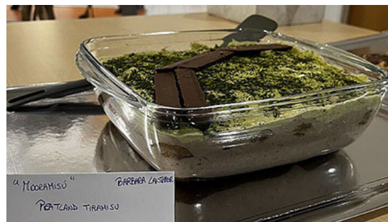
Bake your Research: Moortiramisu, Alpine Glaciers and much more Doctoral School VISESS