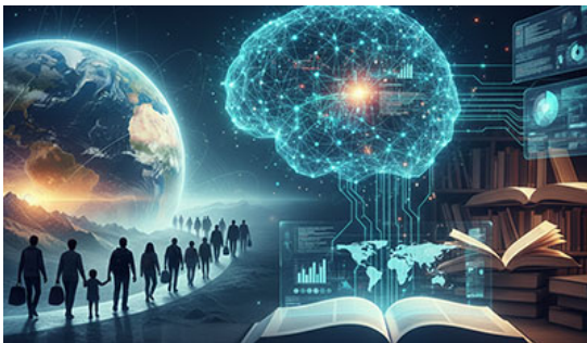
Is AI all we need? Insights from the Climate Change and Migration Fields Big Picture Event 20.01.2026, 15:00

Join us at the UZA II for this event of the doctoral school VISESS to discuss the use of AI in research and policymaking, drawing on the insights of experts and researchers in climate change and migration. More